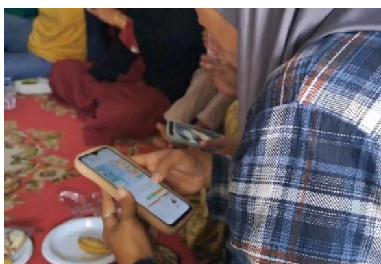
Gambar 3. Sesi Praktik Mencari Media Edukasi

Setelah itu kegiatan dilanjutkan dengan pemaparan materi mengenai mencari media edukasi yang sesuai dengan kebutuhan ibu bayi/balita di internet yang terpercaya, terutama pada website kemkes.go.id dan cara memaparkan media edukasi ke ibu bayi/balita yang baik dan benar. Kemudian dilanjutkan dengan sesi praktik mencari media edukasi yang sesuai dengan kebutuhan ibu bayi/balita dan cara memaparkan media edukasi ke ibu bayi/balita yang baik dan benar. Pada sesi pemaparan materi dan praktik ini, peserta terlihat serius mendengarkan dan sesekali bertanya. Kegiatan kemudian diakhiri dengan sesi post-test untuk melihat ada atau tidak adanya peningkatan pengetahuan dan pemahaman peserta yang dapat dilihat pada Tabel 1.