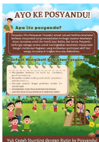
Gambar 2. Hasil Praktik

Setelah materi, peserta diajak mempraktikkan pembuatan poster. Kader berlatih membuat poster informatif dalam suasana interaktif. Setelah program selesai dan poster dibagikan ke grup WhatsApp posyandu, kader kembali membagikan link post-test untuk mengukur peningkatan pengetahuan ibu setelah mendapatkan edukasi poster.