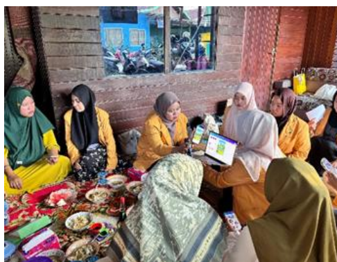
Gambar 3. Pelatihan kader pembuatan poster

Penyebaran poster melalui grup WhatsApp mencerminkan penyesuaian dengan kebiasaan komunikasi masyarakat setempat. Platform seperti WhatsApp sangat efektif dalam menyebarkan informasi kesehatan secara cepat dan hemat biaya. 14 WhatsApp menjadi media efektif untuk menyampaikan informasi langsung kepada ibu balita karena mudah diakses kapan saja. Pendekatan ini sejalan dengan prinsip komunikasi kesehatan modern yang menekankan penggunaan platform sesuai kebutuhan audiens untuk meningkatkan keterlibatan dan dampak. Platform digital berperan dalam promosi dan komunikasi kesehatan, bukan hanya sebagai sumber informasi, tetapi juga sebagai alat interaksi. 15 Umpan balik yang diterima dari ibu-ibu melalui grup WhatsApp menjadi alat evaluasi yang efektif untuk memastikan pesan yang diberikan sesuai dengan kebutuhan mereka.