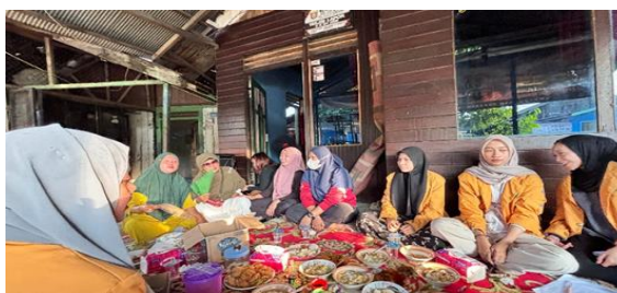
Gambar 5. Diskusi keberlanjutan program

Program GEMES berhasil meningkatkan literasi kesehatan ibu balita, meskipun tantangan infrastruktur, seperti akses fisik ke posyandu, masih menjadi hambatan partisipasi. Pendekatan holistik yang mencakup intervensi media dan perbaikan infrastruktur, seperti akses jalan diperlukan untuk meningkatkan aksesibilitas dan partisipasi. Pemberdayaan kader dan peningkatan pengetahuan ibu balita melalui program GEMES diwujudkan dengan rencana tindak lanjut berupa pembuatan poster bulanan. Menurut Sembiring & Bahrudin, pemberdayaan masyarakat lokal memberikan dampak jangka panjang yang signifikan. 16