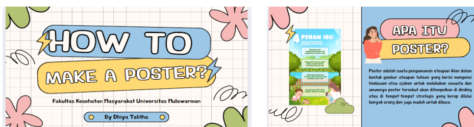
Gambar 1. Materi powerpoint

Sebelum kegiatan, mahasiswa kelompok 4 berdiskusi dengan ibu ketua RT 13, kader posyandu, anggota dasawisma, dan ibu bayi balita untuk menentukan hari pelaksanaan. Pembuatan soal pre-test dan post-test serta media PowerPoint mengenai pengertian, fungsi, dan langkah-langkah pembuatan poster menggunakan aplikasi Canva dilakukan untuk memberikan pemahaman dasar kepada peserta.